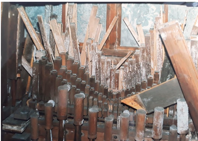
Abb. 4: Auffindungszustand: Reste des Gehäuses nebst Inhalt

Auch das Gehäuse bot einen eher ernüchternden Anblick, wie man den Fotos entnehmen kann. Das stellt aber für jemanden, der mit Holz umzugehen weiß, sicher nicht die große Herausforderung dar.