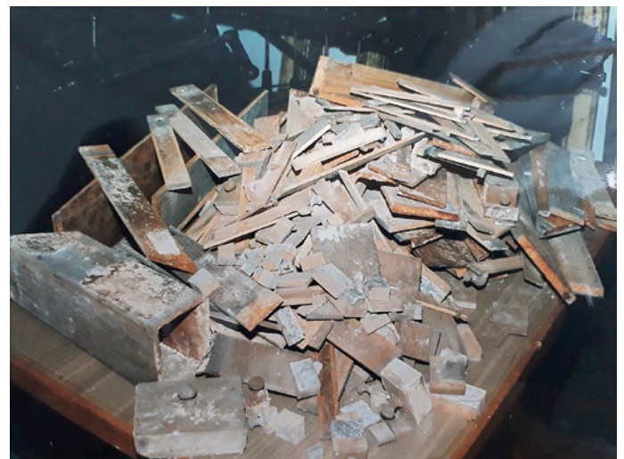
Abb. 2: Auffindungszustand: Das will aufgearbeitet werden!

Ich habe Reiner gefragt, warum man sich so etwas überhaupt aufbaut und auch, wie man vorgeht, wenn eigentlich die Grundsubstanz nicht mehr vorhanden ist. Seine pragmatische Antwort bestand in wenigen Sätzen, ungefähr des Inhalts, dass es ja eigentlich egal sei, ob Pfeifen noch in Kom-