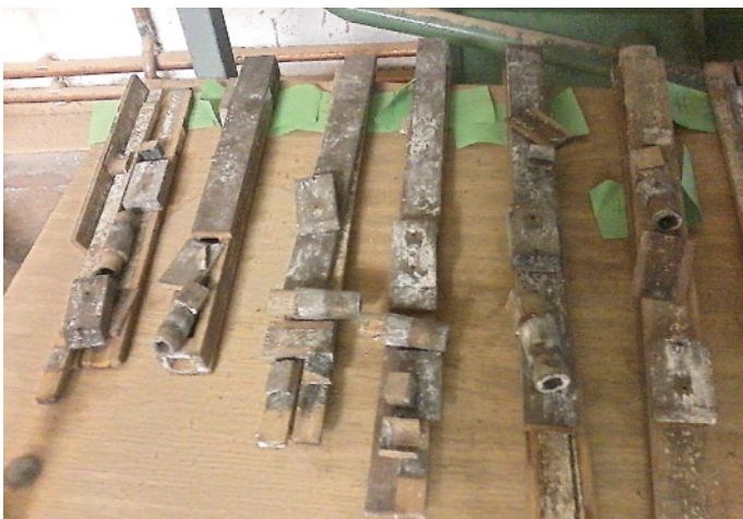
Abb. 3: Weitere Pfeifen zur Aufarbeitung

Beim Zusammensetzen des Puzzlespiels hat man auf jeden Fall Gelegenheit, die Mensur der Holzpfeifen zu rekonstruieren. Dass dieses Vorgehen durchaus aufwändig und mit allerlei Frustrationen verbunden sein kann, hat Reiner auch erwähnt. Wenn man dazu bedenkt, dass diese Orgel mit insgesamt 160 Pfeifen ausgestattet ist, wird erst klar, wie viel Geduld ein Restaurator aufbringen muss, um so ein Instrument zu retten und wieder in einen spielbereiten Zustand zu versetzen.