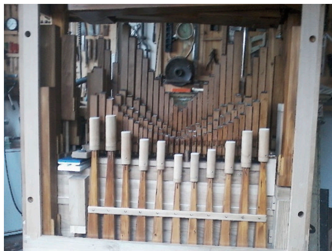
Abb. 5: Ein Lichtblick – aufgearbeitetes Pfeifenwerk im neuen Rahmen

Die größere Frage, die sich stellt, ist diejenige, welche Teile man aufarbeiten kann bzw. will und welche man besser neu anfertigt. Hier gibt es natürlich kein Limit am Aufwand, was die Aufarbeitung der Originalsubstanz anbelangt, oder vielleicht doch, weil man sich natürlich auch stets fragen muss, ob der Erhalt von Teilen diesen Aufwand lohnt. Da befanden sich die Hüttels in der komfortablen Situation, das Instrument für die eigene Sammlung zu restaurieren; eine Kalkulation für den Verkauf des Instrumentes musste deshalb nie angestellt werden. Die beiden Damenfiguren auf der Orgel, die sich mit den Säulen der Orgel beim Spiel mitdrehen (diesen Effekt hat auch die Firma Bacigalupo an einigen durchaus ähnlichen Schrankorgeln verwendet), existierten nicht mehr, also entschloss sich die Familie Hüttel, diese in Tschechien nachfertigen zu lassen. Die Orgelfront wurde vom Original rekonstruiert und komplett neu bemalt, das Ergebnis ist durchaus überzeugend.