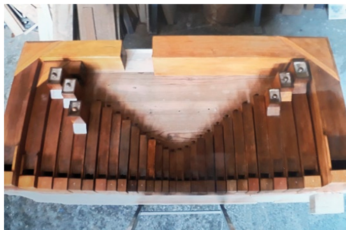
Abb. 6: Aufgearbeitetes Pfeifenwerk im Boden