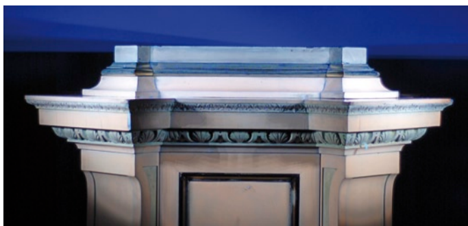
Abb. 5: Untersuchung des Korpus unter UV-Licht

Obwohl die Lackschicht auf dem Untergestell in einem halbwegs guten Zustand war, wurden der Hochglanz und die rötliche Einfärbung beide als störend empfunden. Lichtreflexe, die durch die Hochglanzlackierung hervorgerufen wurden, verhinderten die Freude am Anblick der feinen Nuancen der Maserung des Mahagonifurniers. Durch den dicken Auftrag der Lackierung litten auch die Schnitzereien, deren Kanten dadurch viel zu weich ausschauten. Die Untersuchung mit UV-Licht in Verbindung mit einer Pyrolyse-Gas-Chromatographie-Analyse (py-GC/MS) förderte zutage, dass der Hochglanzlack ein Schellack war, der erst nach der Entfernung der originalen Endbehandlung mit einer in Terpentin gelösten Mischung verschiedener Harze wie Pinie, Gliederzypresse, Schellack und Lärche aufgebracht worden war. In den Bereichen des Korpus, die schwieriger zu erreichen sind, befanden sich noch Reste dieser zuerst verwendeten Mischung, die unter UV-Bestrahlung grünlich fluoreszierten. Schabespuren auf dem Furnier bewiesen, dass die Terpentinharze mechanisch entfernt worden waren.