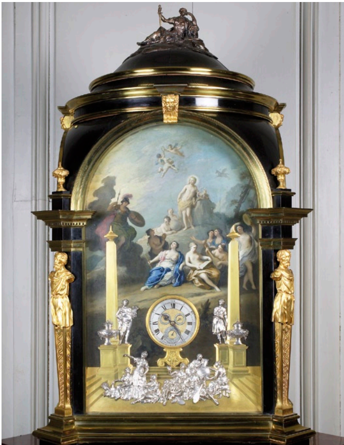
Abb. 2: Die Braamcamp-Uhr