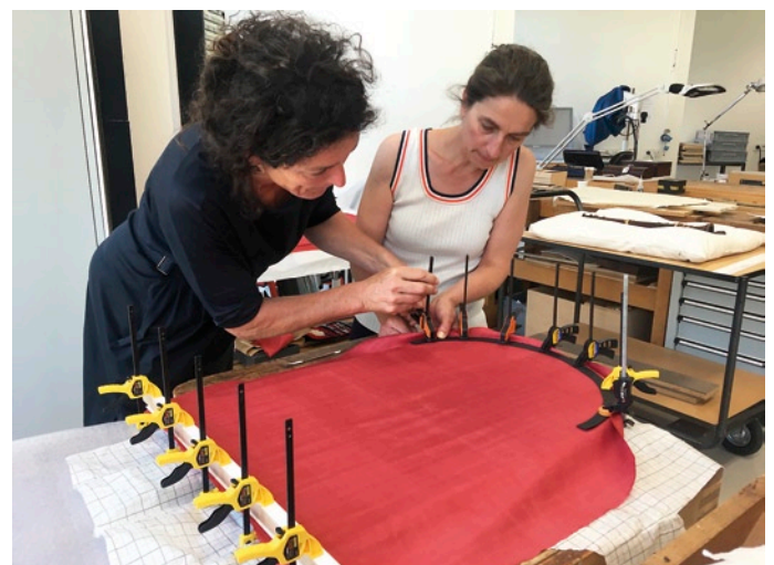
Abb. 12: Aufbringen des neuen Seidenstoffs auf die Seitenteile