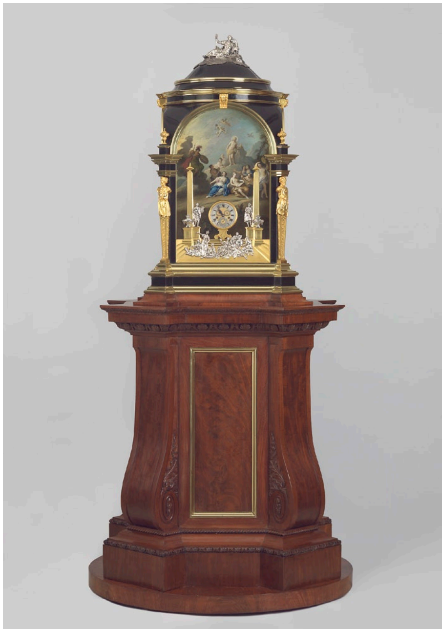
Abb. 13: Die komplettierte Uhr nach Ausführung der Restaurierungsarbeiten

Die Braamcamp-Uhr wird in der ständigen Ausstellung des Museum Speelklok ab Dezember 2019 zu sehen sein.