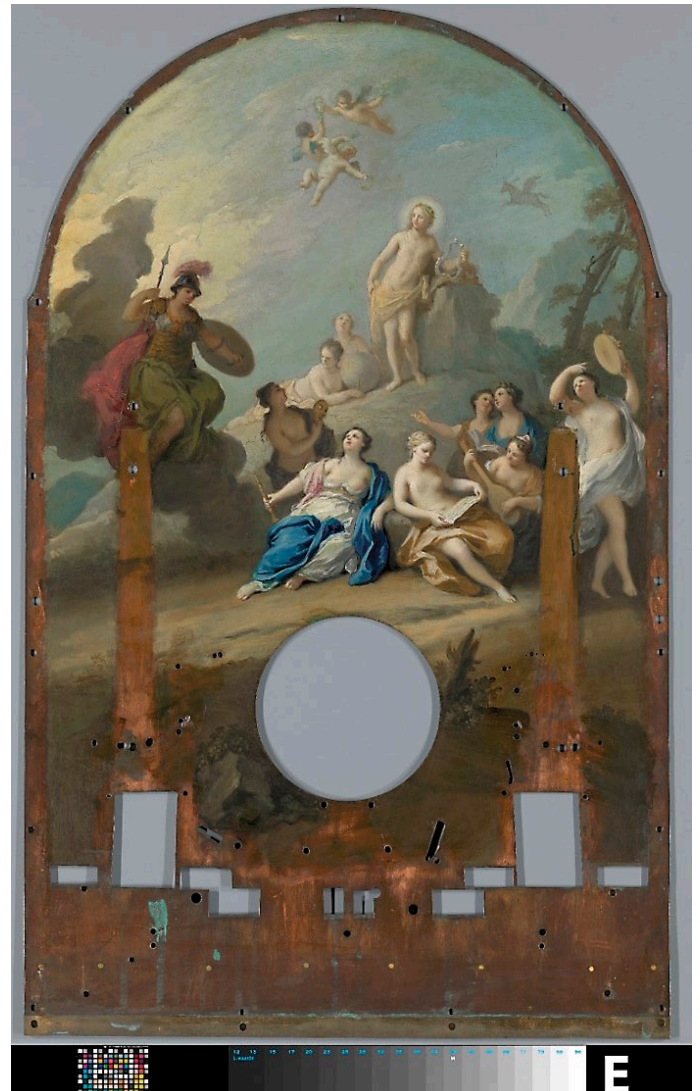
Abb. 11: Die Malereien auf dem Zifferblatt nach Reinigung und Ausbesserung

Die Gemälderestaurationswerkstatt des Rijksmuseums untersuchte das gemalte Zifferblatt mit Infrarot- und UV-Licht. Die Oberfläche des Gemäldes wurde gereinigt und Schadstellen ausgebessert.