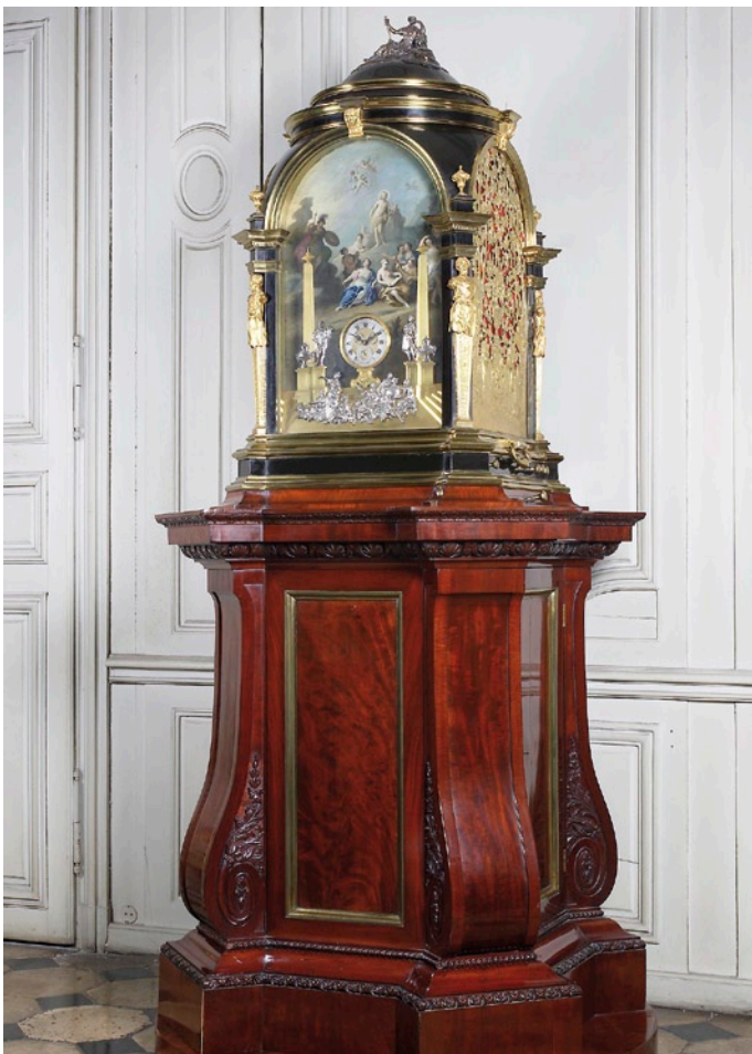
Abb. 3: Die Braamcamp-Uhr mit Untergestell

Minerva. Das Gemälde kann mit ziemlicher Sicherheit dem venezianischen Maler Jacopo Amigoni (ca. 1685-1752) zugeschrieben werden. Diese Vorderseite der Uhr wird umrahmt von einem Flachrelief aus feuervergoldeter Bronze, das den Eindruck einer dreidimensionalen Architektur erzeugen soll und aus zwei, mit jeweils einer Vase bekrönten Obelisken und zwei weiteren kunstvollen Vasen besteht. Als Hochreliefs sind die Figuren von Apollo und Diana in Silberguss ausgeführt. Diese wurden von John Michael Rysbrack (1694-1770) hergestellt. Rysbrack zeichnet auch verantwortlich für die lebendig dargestellte Gruppe der Künste unterhalb der Figuren, die ebenfalls als Hochrelief in Silber gegossen sind.