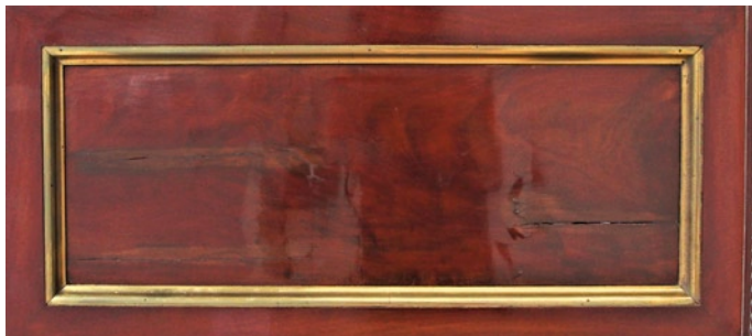
Abb. 4: Detail der Seitenteile mit ihren Beschädigungen

Das Mahagonifurnier war nicht nur lose und hob sich vom hölzernen Untergrund ab, sondern es fanden sich auch Risse und Dellen sowohl im Furnier als auch an den geschnitzten Mahagonielementen. Das Vollholz sowohl der Seitenteile als auch des Untergestells wies Risse auf, und in diesen Risszonen war auch das Furnier gebrochen und warf Blasen; auch hatten sich Farbveränderungen des Furniers entlang dieser Risse ergeben.