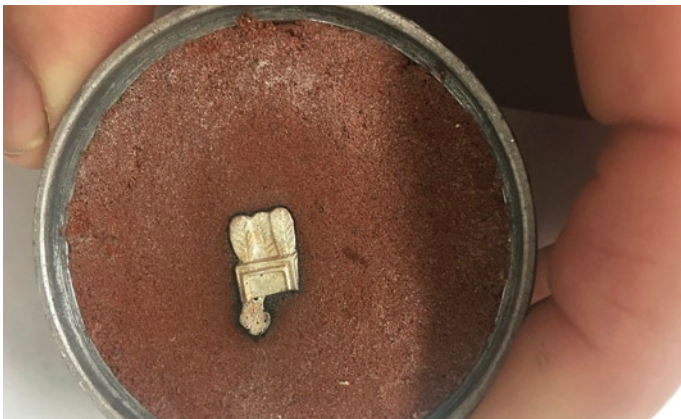
Abb. 7, 8 und 9: Wiederherstellung des Köchers