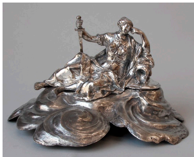
Abb. 6 und 7: Die Bronze der Bekrönung vor und nach der Restaurierung

Für Dianas verlorenen Köcher wurde in Silberguss Ersatz geschaffen, als Muster dienten alte Photographien der Braamcamp-Uhr.