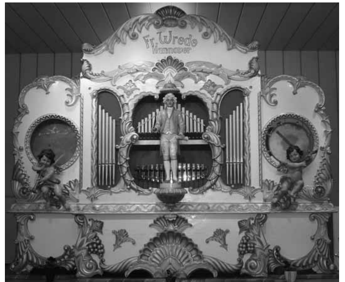
59er Wrede von Theo de Voer, Ulvenhout, aus dem Jahre 1924. Front und Dirigentenfigur können Wilhelm Marienfeld zugeschrieben werden.

Er bewohnte bis zu seinem Tode am 30. April 1971 eine Genossenschaftswohnung in der Berckhusenstraße 45.