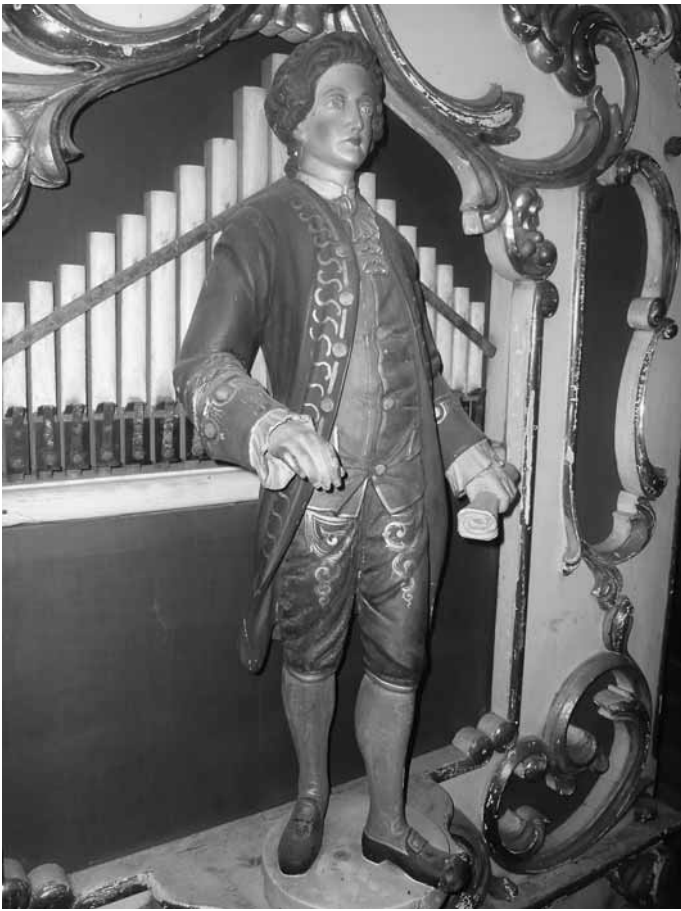
Kapellmeister von Friedrich Scheck, Sammlung Daniel de Bie

Alten-Allee. Auch sie waren für Wrede tätig und besorgten die farbliche Fassung der Fronten. Sowohl die Werkstatt Jauslin als auch die Werkstatt Scheck wurden 1943 bei einem Bombenangriff vernichtet.