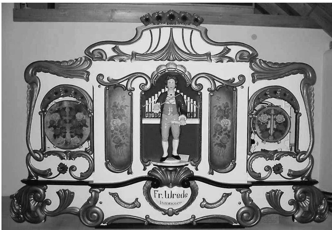
Karussellorgel aus der Werkstatt von Fritz Wrede mit 67 Tonstufen im Schwarzwaldmuseum Triberg (Kurt-Niemuth-Stiftung).

Wolf, Roland, „Das Mechanische Musikinstrument“ Nr. 47, Juli 1989, Seite 15-19