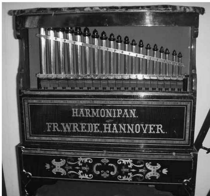
33er Harmonipan von Fritz Wrede (Eigentum des Verfassers), Bauzeit vor dem Ersten Weltkrieg

Selten zu finden sind Trompetenorgeln mit 35 Tonstufen aus Wredes Werkstatt. Solche Instrumente stammen aus der frühen Schaffenszeit Wredes und sollten ihm nur unter Vorbehalt zugeschrieben werden.