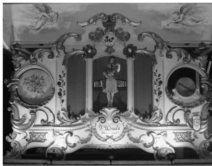
Frühe 69er Wrede-Orgel des Schaustellers Frits de Voer (Apeldoorn) aus dem Jahre 1906