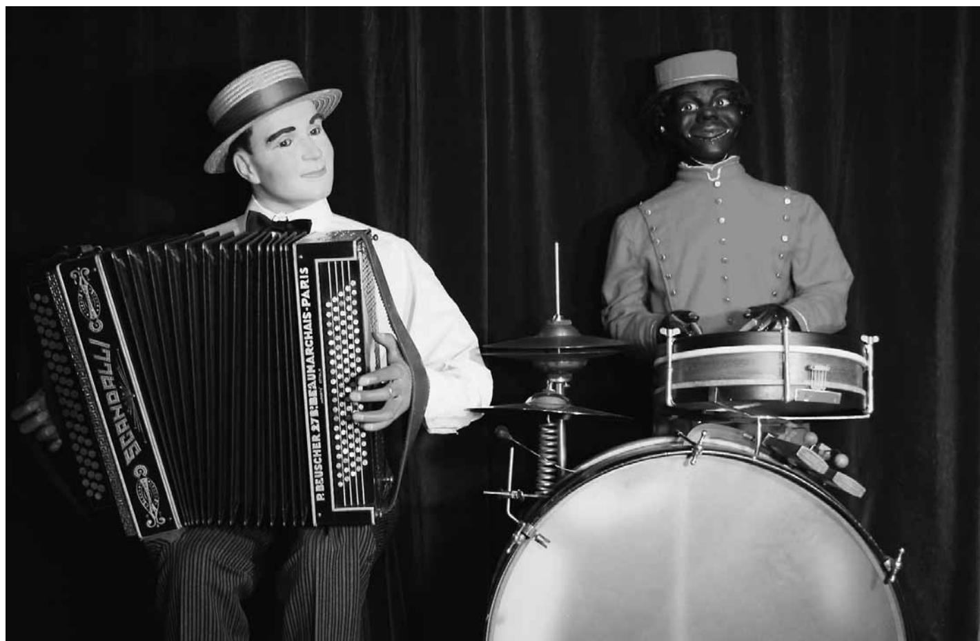
„Accordéo-Boy“, J. Bodson, Paris um 1928. Deutsches Musikautomaten-Museum Bruchsal, Inv. Nr. 85/204