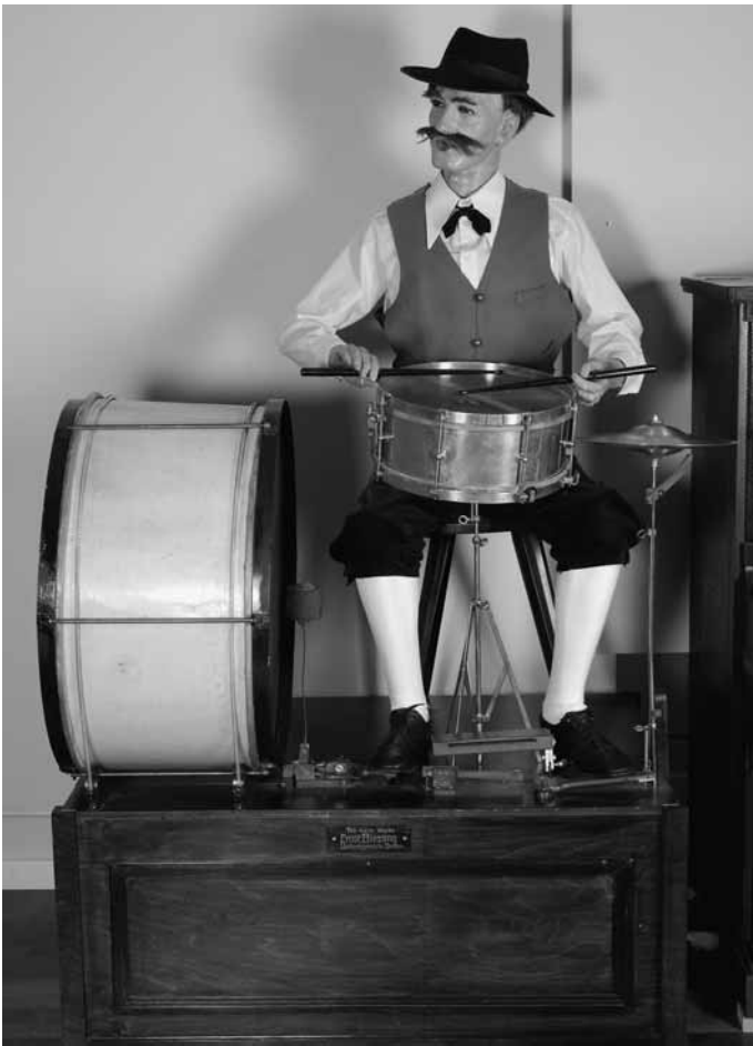
Androide „Felix von der Au“

Klaviergehäuses, links neben den Motor, eine Stiftwalze ein, die er über Transmissionsriemen antreibt und die über Elektrokontakte das Flötenspiel im Brustkorb des Androiden auslöst. Die Zuleitung zum neben dem Pianola montierten Androiden erfolgt über einen „Versorgungsstrang“. Dieser Androide (H 144 cm, B 74 cm und T 60 cm) sitzt auf einem Podium, an welchem das Werkstattschild befestigt ist: „Fab.mech.Werke / Ernst Blessing / Unterkirnach, Baden“.